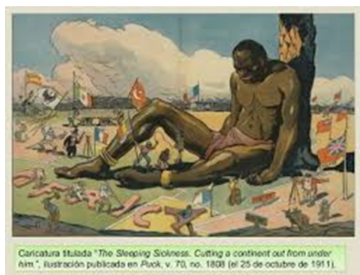
Caricatura titulada "The Sleeping Goliath. Cutting a continent out from under him", ilustración publicada en Puck, v. 70, no. 1808 (el 25 de octubre de 1911).

3- América Latina y EEUU. Analizar la siguiente frase y responder las preguntas: